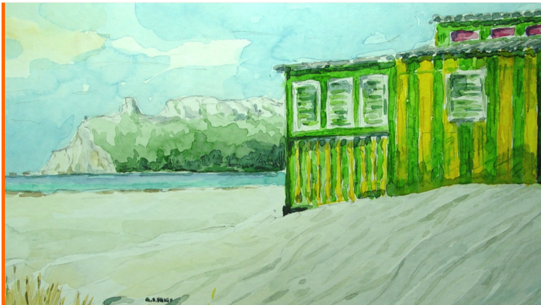
Autore: Giovanni Stefano Frigo

8-9 Maggio 2015 Caesar's Hotel, Cagliari